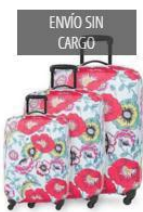
ENVÍO SIN CARGO PACK DE FUNDAS - POR 3 UNIDADES (CHICA), $2800,00

Una vez que estés en nuestra tienda online, vas a poder visualizar todos nuestros productos. Seleccioná el canjeado en la página de LANPASS.