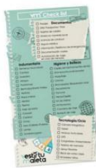
CHECK LIST - BLOCK X 20 HOJAS $99,00